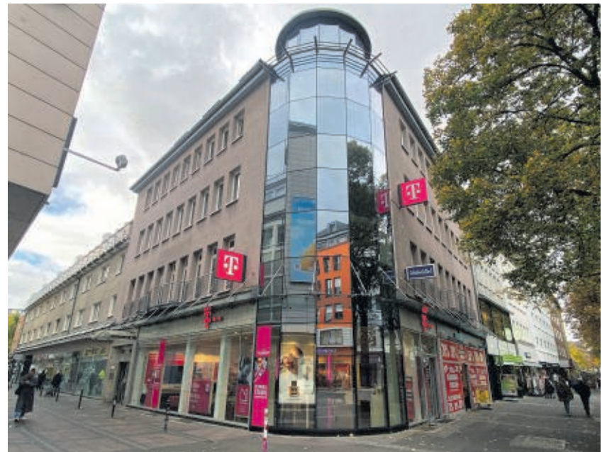
Im vergangenen Jahr machten diese Häuser in der Spinnngasse inmitten der Hagener City Schlagzeilen. Der Besitzer beglich seine Rechnungen bei dem Energieversorger nicht, obwohl die Mieter ihre Miete zahlten. So stand das Haus kurz vor der Unbewohnbarkeit.

Wird das Gesetz im Juni dieses Jahres im Landtag beschlossen, könnte es im Herbst in Kraft treten.