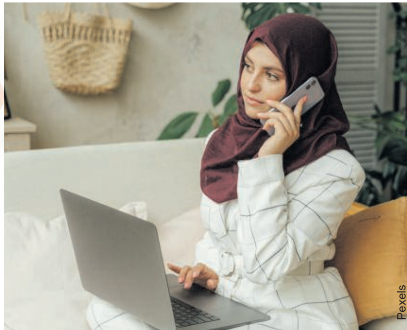
Aufgrund ihres ausländisch klingenden Namens dürfen Wohnungsinteressenten nicht benachteiligt werden - so urteilte der BGH.

Der Deutsche Mieterbund rät Betroffenen, Abläufe und Aussagen festzuhalten und sich frühzeitig beraten zu lassen. Mögliche Ansprüche müssen innerhalb kurzer gesetzlicher Fristen geltend gemacht werden. „Das BGH-Urteil zeigt deutlich: Der Rechtsstaat bietet wirksamen Schutz vor Diskriminierung auf dem Wohnungsmarkt“, erklärt die Präsidentin des Deutschen Mieterbundes.