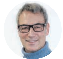
von RA Martin Kroll

Das Amtsgericht stellte klar: Der Klägerin steht gegen die Beklagten als Gesamtschuldner kein Anspruch auf Zahlung von 1881,48 Euro aus der Nebenkostenabrechnung für das Jahr 2023 zu. Ebenso wenig die geforderte Zahlung der Zinsen. Wird das Urteil rechtskräftig, wird Cosmo Properties 3 auch die Kosten des Verfahrens tragen müssen.